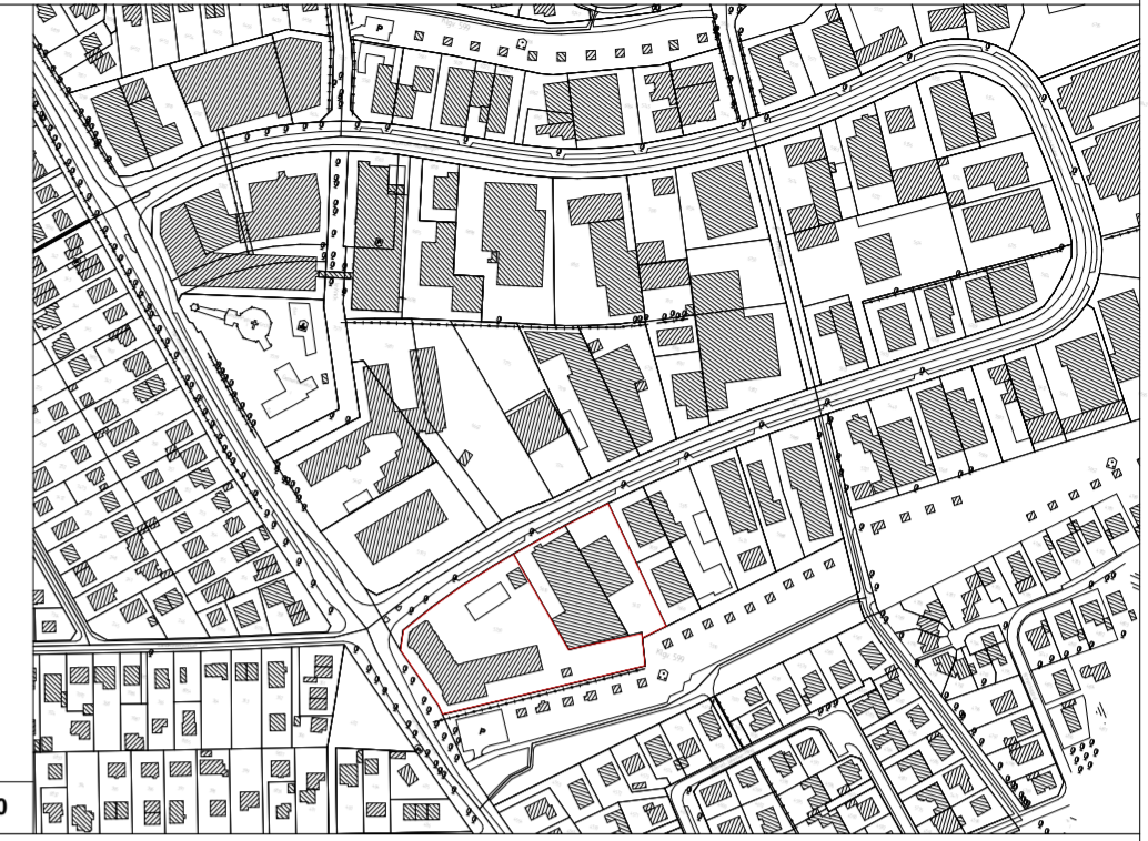
Übersichtsplan M 1:5000