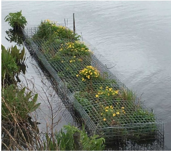
Abb. 1: Das Beispielfoto einer noch ohne Unterwasserzonierung ausgebildeten 7 Quadratmeter großen schwimmenden Insel in der Außenalster wurde am 5. Mai 2021 aufgenommen. Die Vegetation wurde im Winter vom Bisam dezimiert, wächst aber im Frühjahr lebhaft wieder auf.

Prototyp Var. 1 Schwimminsel mit UW-Vegetation VORABZUG - Stand 22.03.21